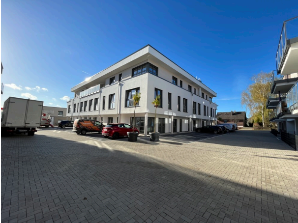
Wohnen und Gesundheit im Johannesweg