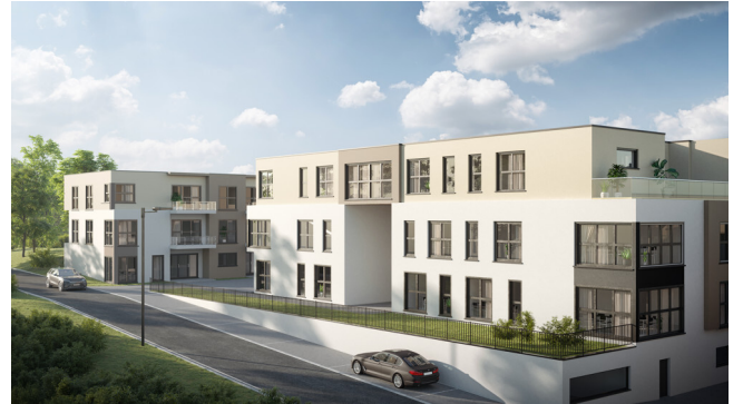
Wohnen und Gesundheit im Johannesweg