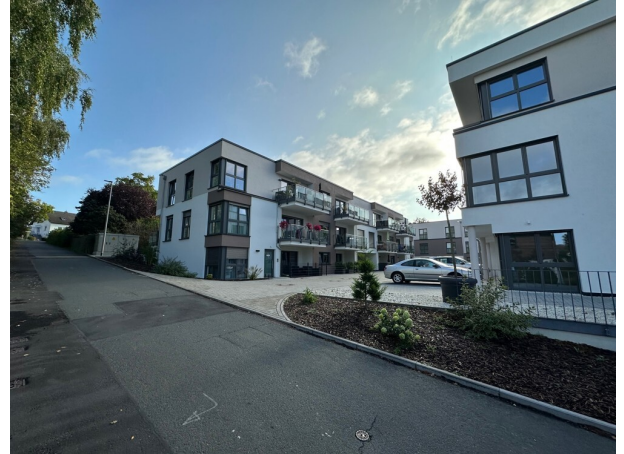
Haus Johanneshöhe (2)