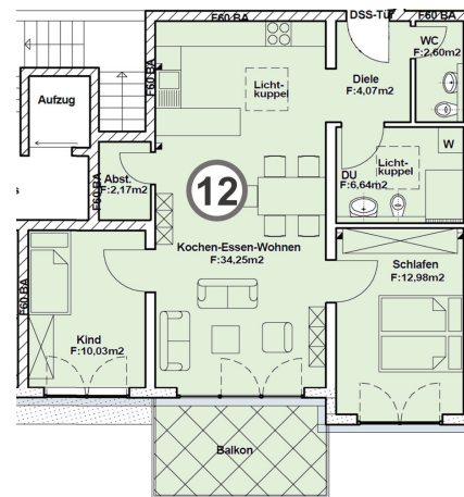
Gebäude 3_Wohnung 12