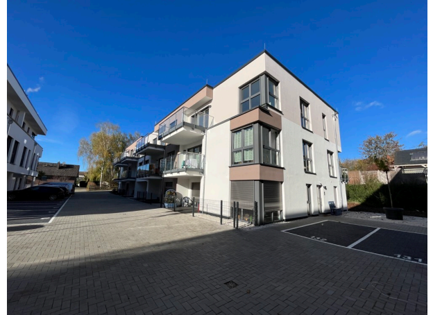
Haus Johanneshöhe (3)