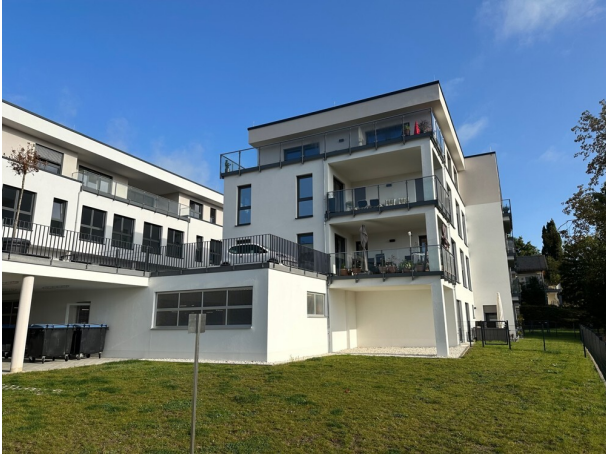
Haus Johannesblick (2)