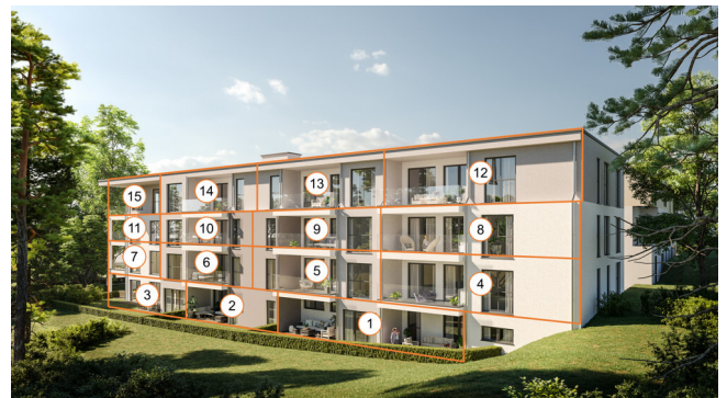
Visualisierung Haus Johannesblick