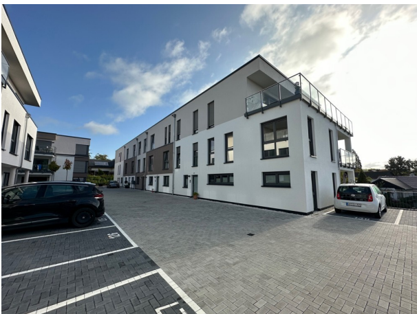
Haus Johannesblick (4)