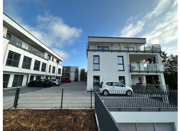
Haus Johannesblick (3)